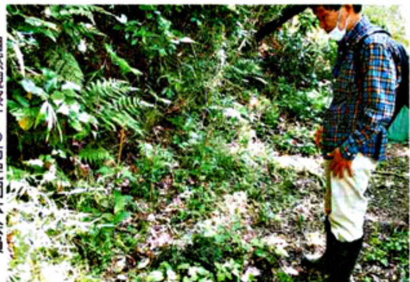
自然観察する市民団体会員