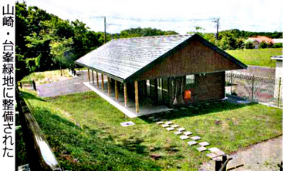
山崎・台峯緑地に整備された 南管理事務所