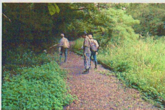
堤防工事の後、撤去される台峯南側(「谷戸の池」付近)の工所用仮設路。道幅を狭くし、自然と調和した散策路として作り直される