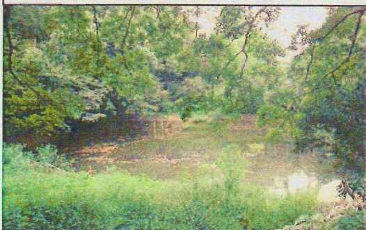
ヘドロが除去された「谷戸の池」