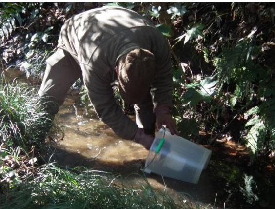
<環境変化により川に産んでしまったヒキガエルの卵を、右上写真の専用池に移動>