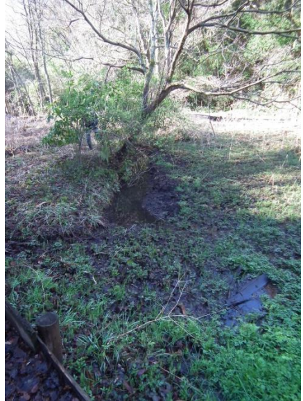
<堤体拡幅に備え、カエル産卵用池は堤から離して設置>