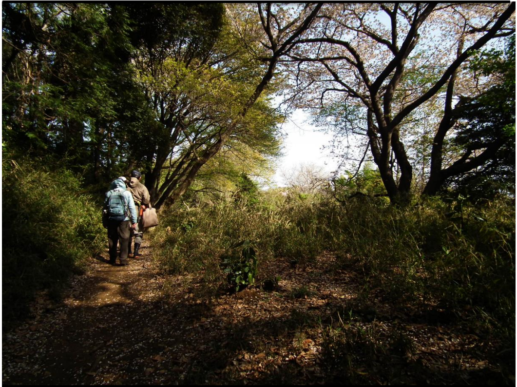
<モニタリング風景>