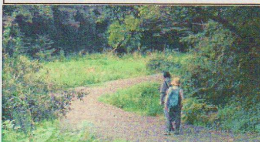
緊急用の車両侵入路として残される、台峯北側の工所用仮設路