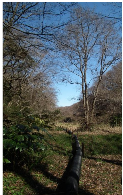
<堤脇から見た「谷戸三郎」と排水用ホース>