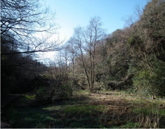
<堤体遠望。3本立ちの「谷戸三郎」は残るが、その奥左のハンノキは幅広となる堤に掛かってしまう>

「谷戸の池」堤体の工事により変わる風景があります。35号に続き、現在の姿をまとめました。