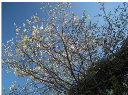
<台峯で一番早く開花するというオオシマザクラ>