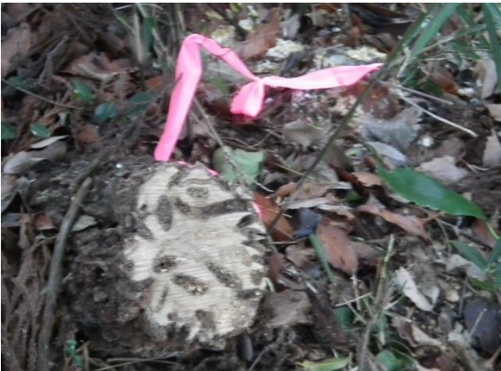
<市による樹木整理 危険な樹や枝が伐採されています>