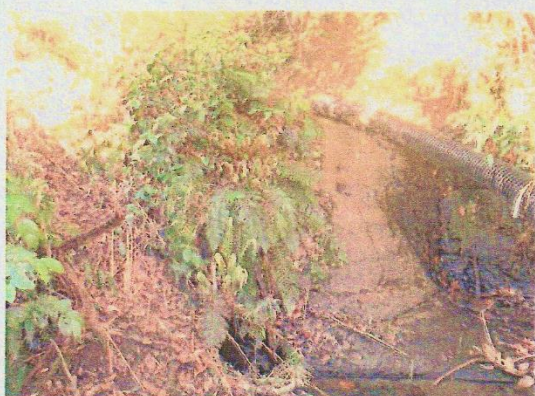
改修される堤防の落ち口 水抜きできる排水管と水門が設置される