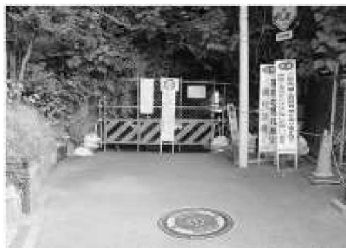
送水管空気弁(9頁) V ^ 手前に横須賀市への 通行止の「緑の洞門」

本件については3月発行の本誌前号でもお伝えしましたが、鎌倉市は北鎌倉駅下りホーム脇にあるトンネルが危険であると、この4月には実際に封鎖、通行を禁止しました。このため、現在一般に改札口から大船方面に向かうには、う回路として交通量の多い県道など線路の反対側を使う以外ありません。