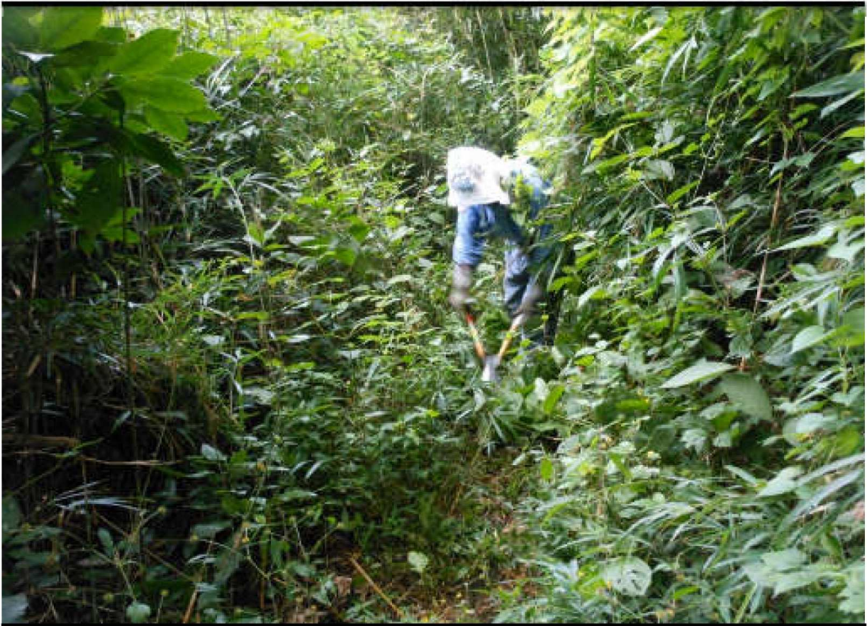
(山の手入れ P. 11参照)