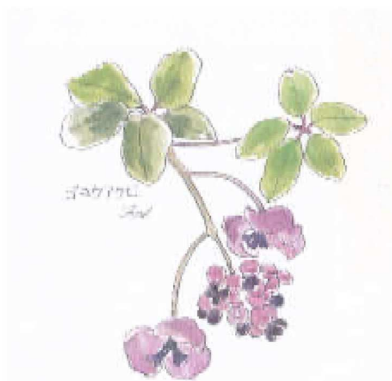
ゴヨウアケビ (2015年5月)