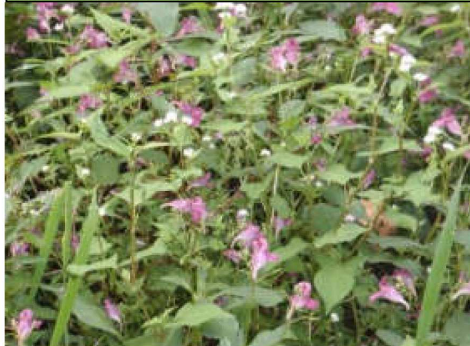
ミゾソバとツリフネソウの花