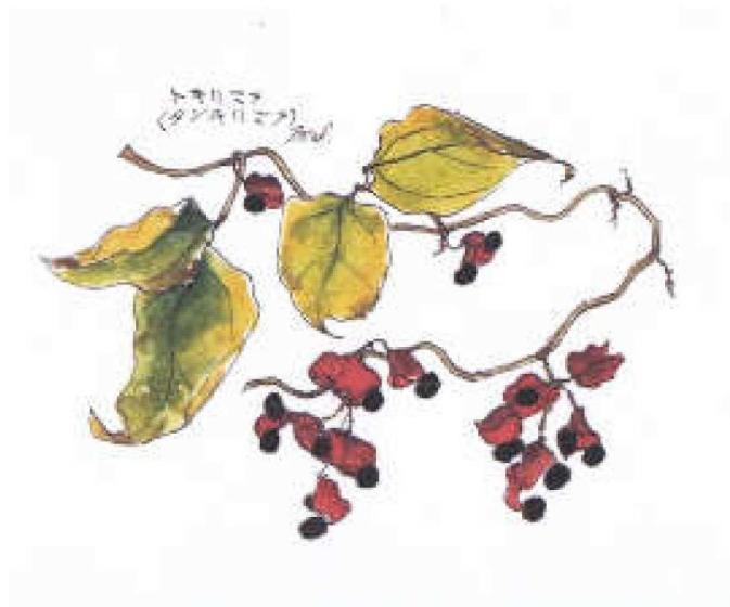
トキリマメ (タンキリマメ) (2014年12月)