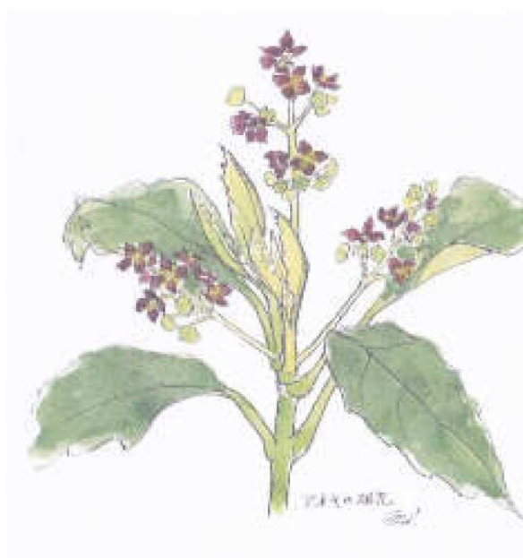
アオキの雄花 (2015年4月)