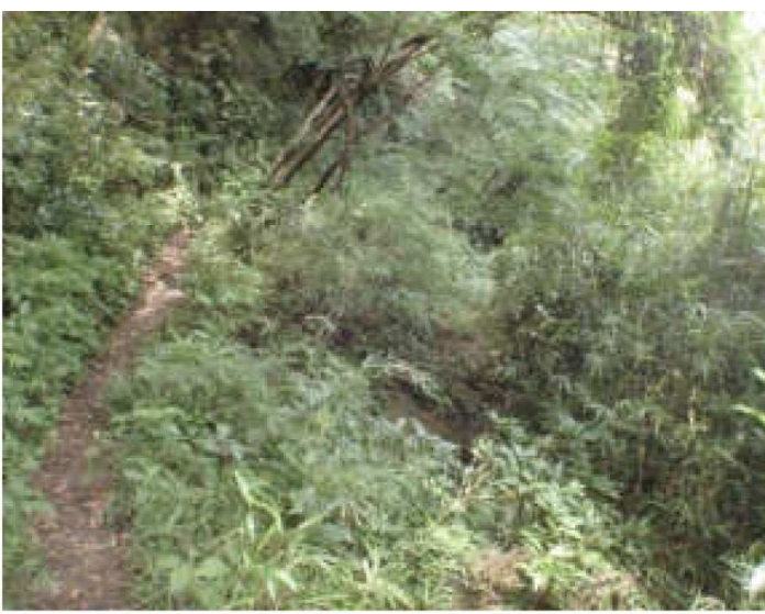
写真① 水路に沿った現在の散策路、水路側に石垣を創る工事は取りやめになった。