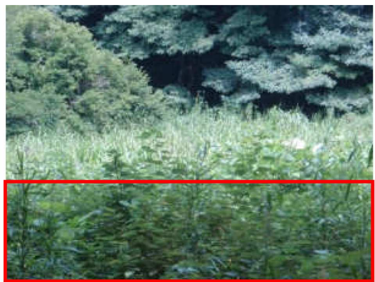
写真② 枠線の部分が仮設路となる。背後のオギ原や斜面林はそのまま残る。

に使われてしまいます。「歩く会」のメインルートになっており、良好な湿地が残っている場所ですが池の再生のためにはやむをえません。湿地への影響を最小限にするため、仮設路を設置する際の工法について検討していく予定です。