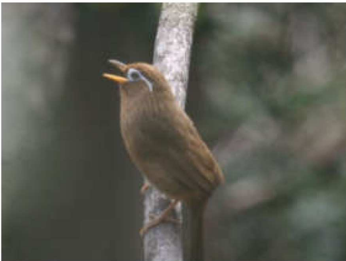
ガビチョウ(画眉鳥)

今年は野鳥に大きな変化を感じています。外来種であるガビチョウが増えた事、キビタキやオオルリなど深山に棲む森林性の小鳥が台峯に定着してきたことです。